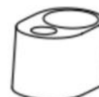
Accessory Holder x1